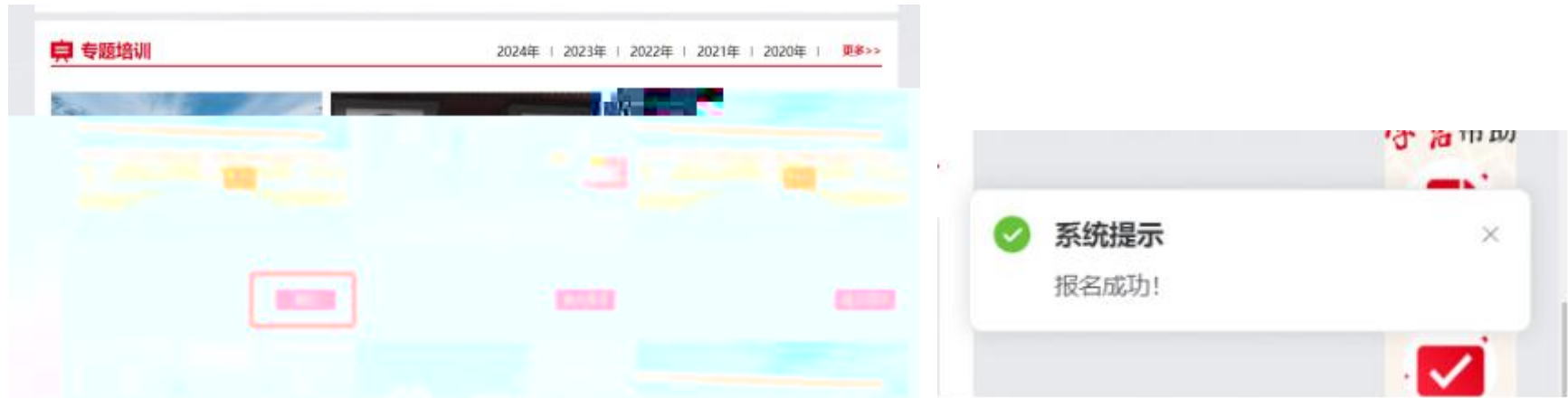
(电 端 报 )

(1) 报 。 “ ” ， 点 “报 ” 按 。 动端报 ， 点 动端 方 “ ” ， ， 点 “报 ” 按 。