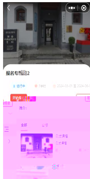
( 移动端 )