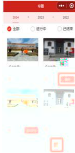
( 动 报 )

(2) 。点 “ ”， 报 表 “ ”， 点 “ ” 对 程 ， 当 度 100% ， 成 的 。 动端 ， 点 动端 方 “ ”， “ ”， 对 程 。