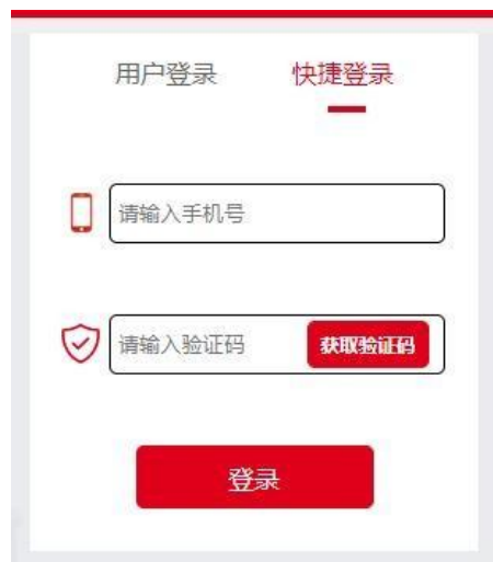
( 电 端 登 窗 )